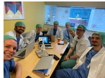
Parallell journalføring i gang!