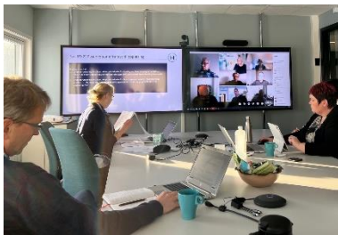
Et digitalt styremøte godkjente faseovergangen.

Hver og én som står på for Helseplattformen skulle fått høre et begeistret styre som roste alle for fantastisk arbeid, spesielt med innsatsen for å rette gjenstående utfordringer. Du kan lese mer på de offentlige nettsidene: https://helseplattformen.no/om-oss/helseplattformen-as/styret-godkjente-faseovergang